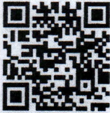
วิดีโอการสมัครสมาชิก