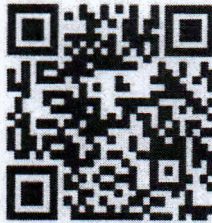
ขั้นตอนการสมัครสมาชิก