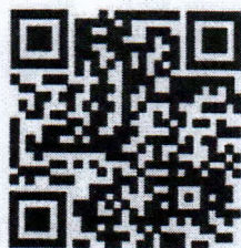
ใบสมัครสำหรับบุคลากรสังกัด กรมส่งเสริมการปกครองท้องถิ่น