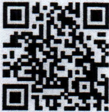
ใบสมัครสำหรับบุคลากรสังกัด องค์กรปกครองส่วนท้องถิ่น