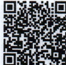
สมัครสมาชิก